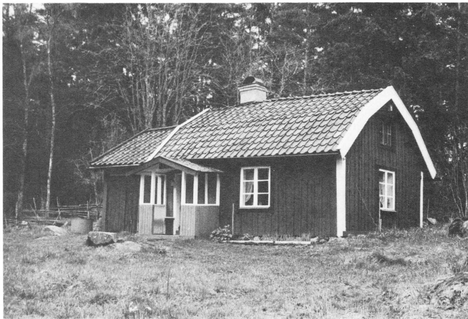
Backstugan Fridhem den 1 maj 1983.