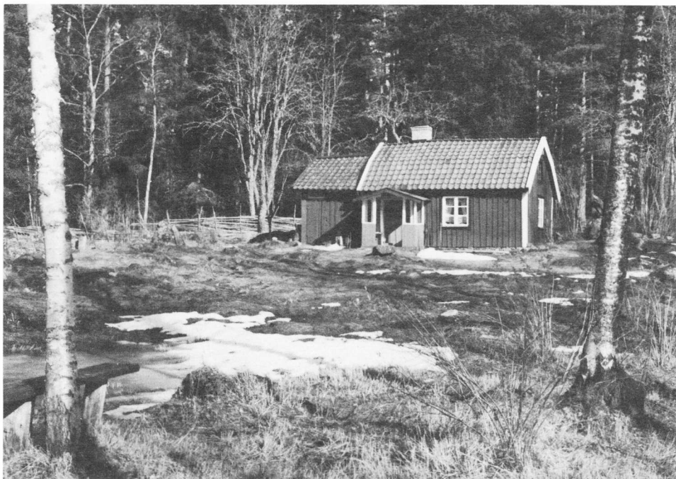
Fridhem i vårens tid den 4 april 1986.